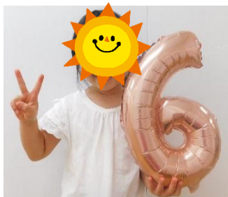
18日 よこは えなちゃん