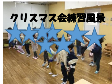
クリスマス会練習風景

11月前半より、クリスマス会ダンスの練習を始めました。保育者のダンスを見ながら、みんなで楽しく練習に取り組んでいます★本番が楽しみですね！