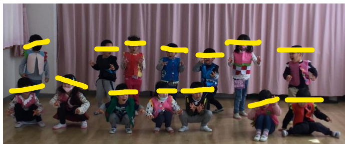
クリスマス会リハーサルの写真です

冬休み中は風邪や感染症などに気をつけ、1月からも元気に登園してくださいね。 2021年もどうぞよろしく願いいたします。