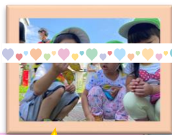
いろいろな遊びをたのしんだね♡