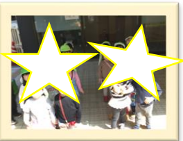
はじめてのおさんぽ♪