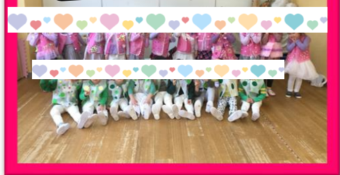
みんなで力を合わせて頑張ったクリスマス会！ 良い思い出になったね♡