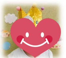
11日 いとうなぎちゃん