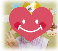
12日 おだあいこちゃん