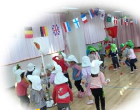
玉入れ用意 スタート！！

10月20日、4階プレイルームで運動会を行いました！今年はコロナの影響により保護者の方に見て頂けず大変残念でしたが、子どもたちは「運動会いつ？」「あと何回寝たら運動会?!」と数日前から待ちきれずずっと楽しみにしていました♪今回の運動会で行った電車ごっこではお友達と一緒に体を動かすことの楽しさ、玉入れではみんなで力を合わせてゲームを行う楽しさを体験してほしいという思いがあったのでこのような競技にしました☆そして、どんなことにも一生懸命に取り組む子どもたちの姿にとっても成長を感じました(>_<)♪とても頼もしい姿を見せてくれたらっこ組さん！今後も子どもたちの成長から目が離せません♡