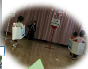
電車に乗って駅 を目指して…